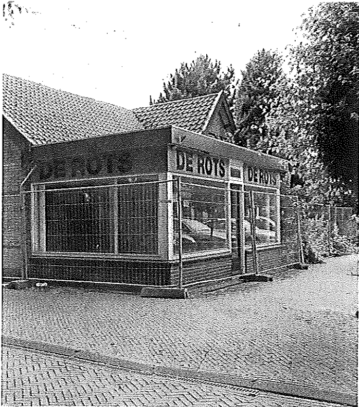
'is inmiddels een jaren-