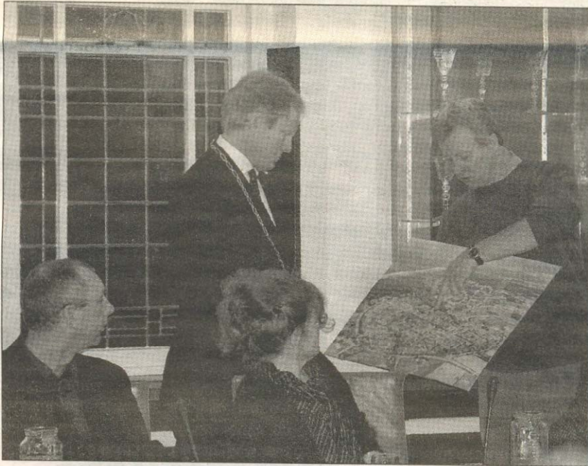
Het college van B en W nam een petitie in ontvangst van de stichting Houd Rockanje Laag.

De omwonenden van locatie de Rots in het centrum van Rockanje maken zich zorgen over de bouwplannen, die het historisch gegroeide, kleinschalige bouwkundige karakter en de oorspronkelijke stedenbouwkundige structuur van het dorp Rockanje kunnen verstoren. De inwoners maakten ook hun onvrede kenbaar over de zorgvuldigheid waarmee de bouwplannen voor locatie de Rots vorm krijgen. Zij vernamen via de pers dat er bouwplannen zijn, terwijl het be-