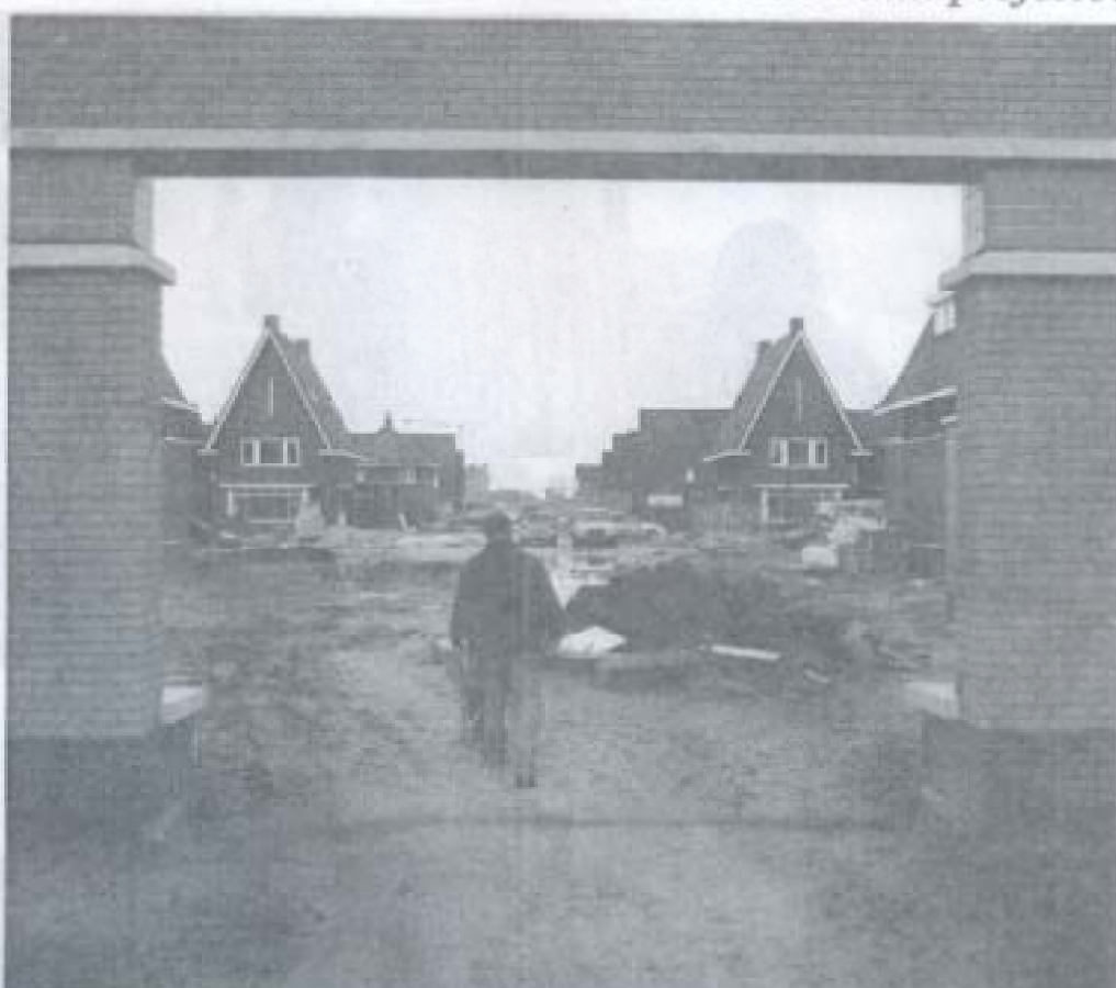
In de wijk Koolhoven in Tilburg worden goedkope woningen in jaren dertig stijl gebouwd.